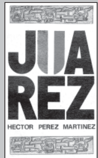
ROBERTO CASANUEVA: libro, 1973. Editorial de Ciencias Sociales