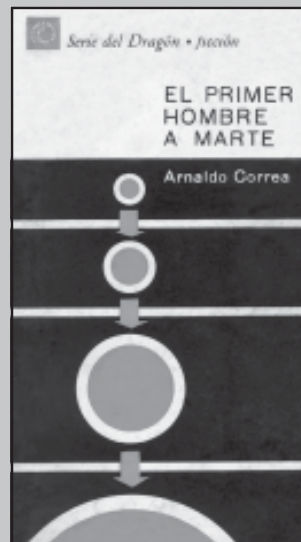
SANTIAGO ARMADA: libro, 1967. Ediciones Granma