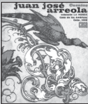
UMBERTO PEÑA: libro, 1969. Casa de las Américas