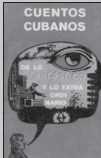
FAYAD JAMÍS: libro, 1968. Ediciones Unión