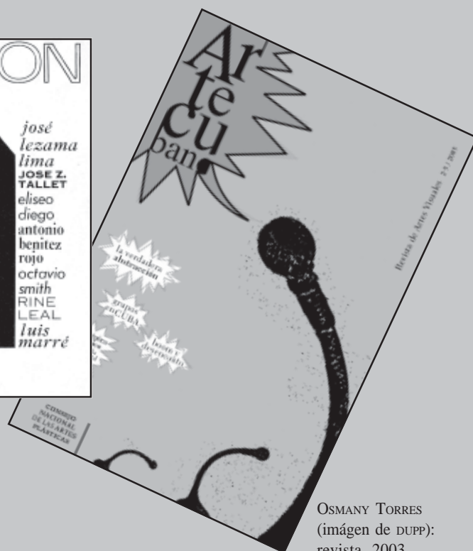
OSMANY TORRES (imagen de DUPP): revista, 2003