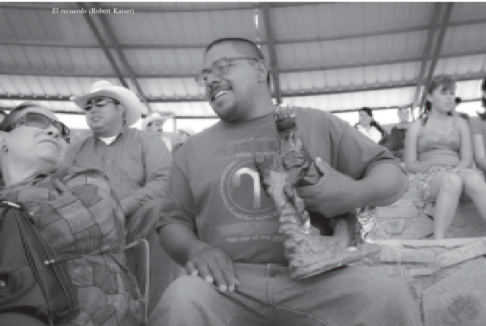
El recuerdo (Robert Kaiser)

Sollors, Warner (ed.): The Invention of Ethnicity , Oxford, Oxford UP, 1989.